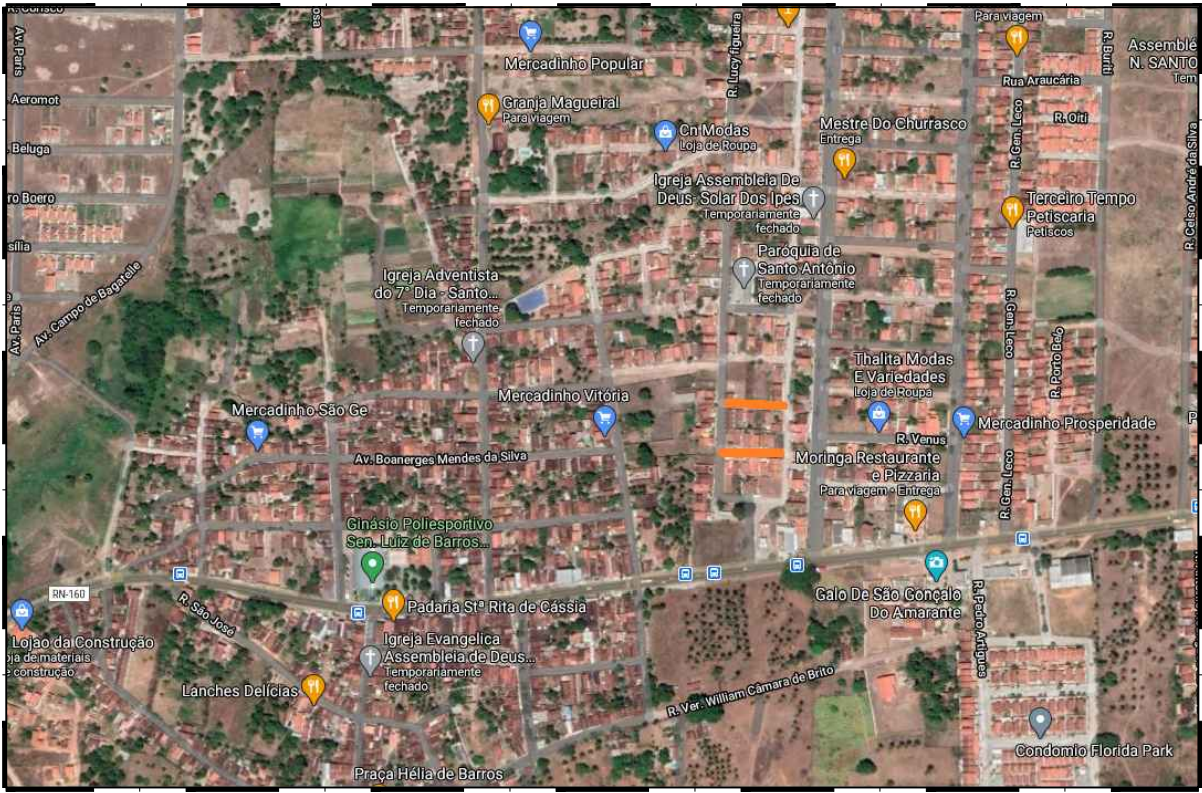
IMAGEM AÉREA IDENTIFICAÇÃO BAIRRO SANTO ANTÔNIO ESCALA NÃO DEFINIDA