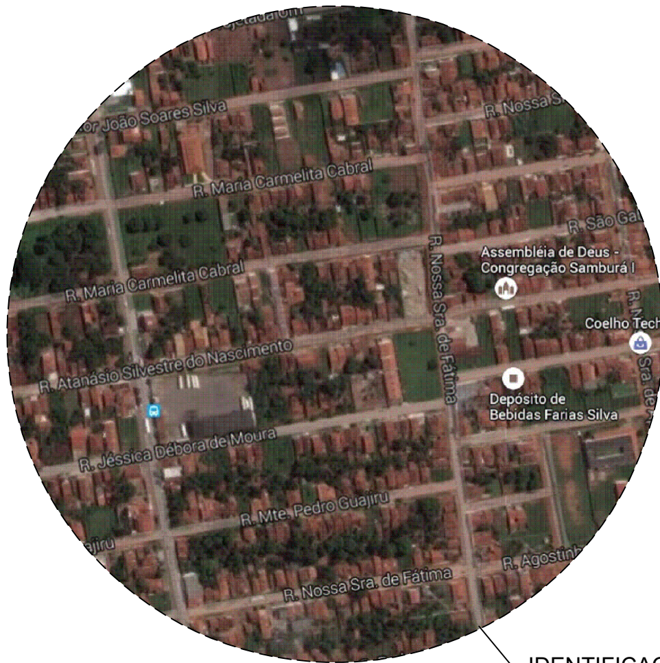
IDENTIFICAÇÃO DE TRECHO - SAMBURÁ