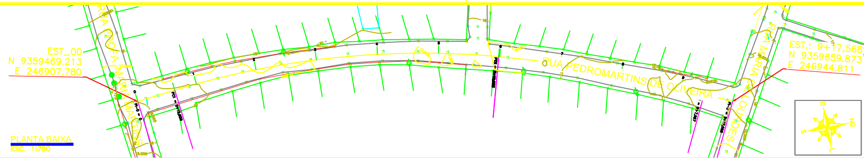
PLANTA BAIXA ESC.: 1/750