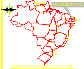
PLANTA DE LOCALIZAÇÃO NO BRASIL

SISTEMA DE COORDENADAS SIRGA2000 ZONA:25 - MERID. CENTRAL - 33, SUL