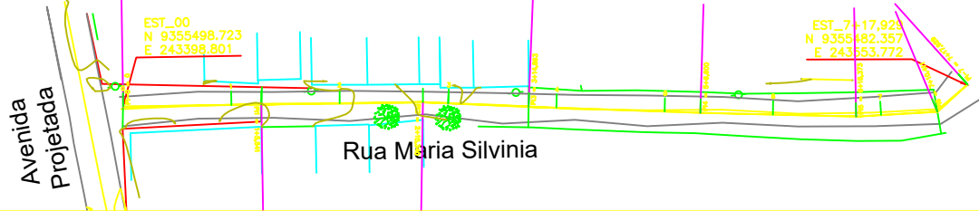
PLANTA BAIXA ESC. 1/750