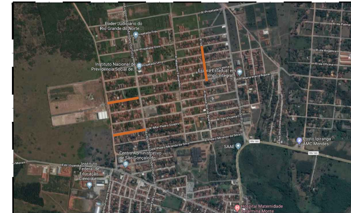
IMAGEM AÉREA IDENTIFICAÇÃO BAIRRO SANTA TEREZINHA ESCALA NÃO DEFINIDA